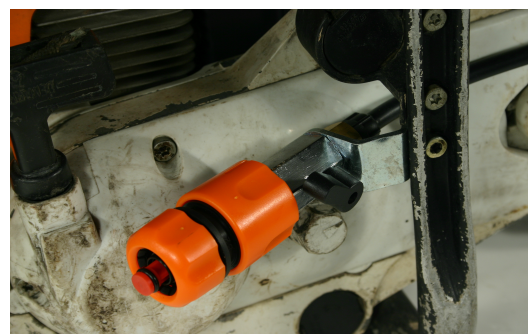
Befestigung der Düse (wie abgebildet)